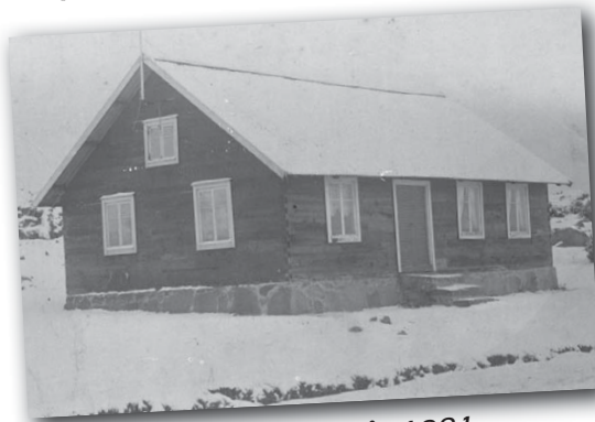
Senorens Missionshus år 1881.

1921 var det dags för en omfattande renowing och ombyggnad av Missionshuset, då man också lät inhägnat tomten runt omkring. Genom åren har sedan flera renowingar och tillbyggnader genomförts för att anpassa lokalerna till den verksamhet som bedrivs idag.