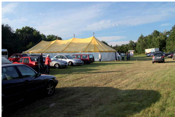
Bilar samlas på ängen utanför tältet på Senoren.

Under försommaren har vi också tilläggsisolerat och satt upp ny